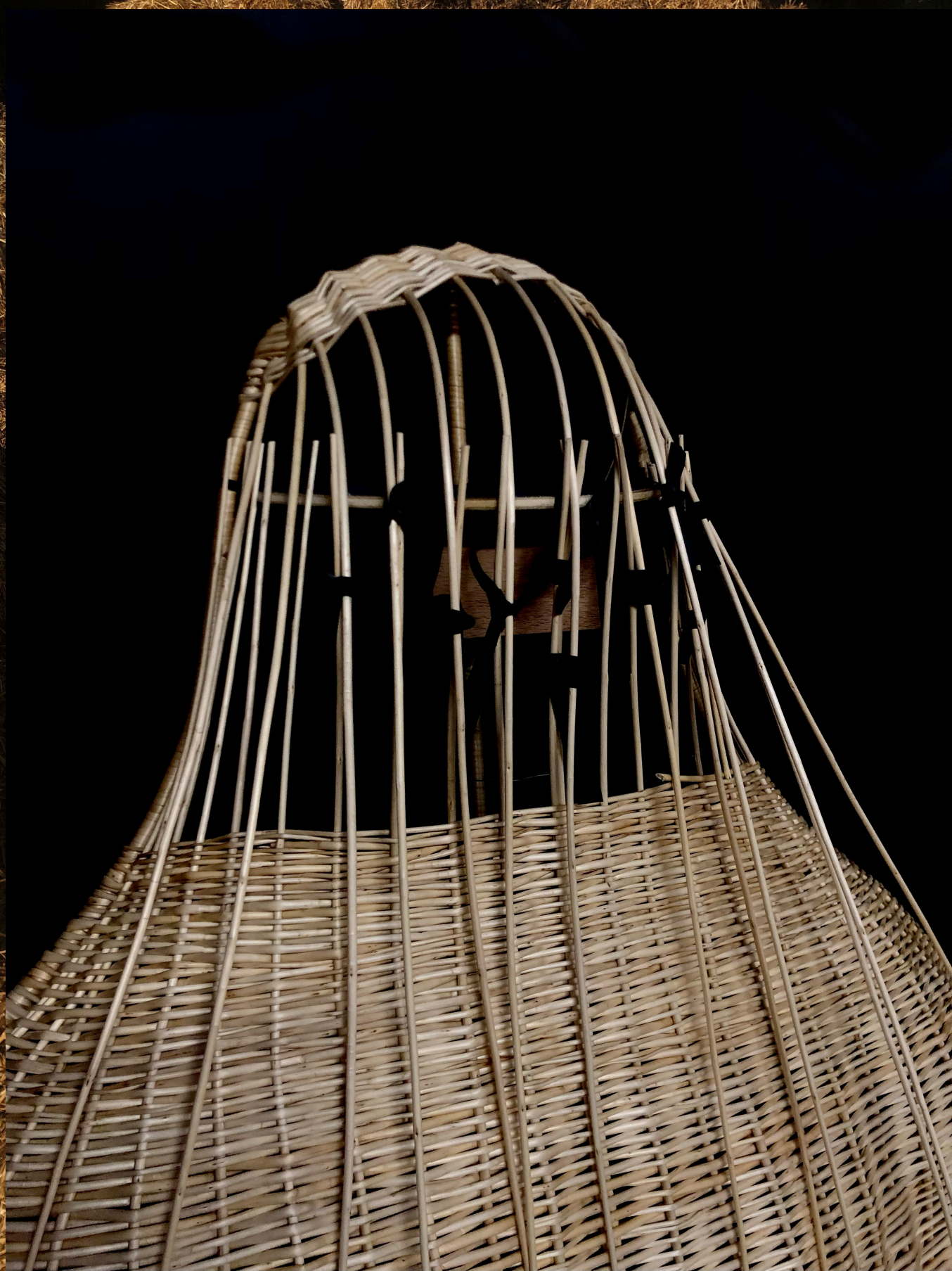
La malle, travail en cours, Pau, décembre 2023