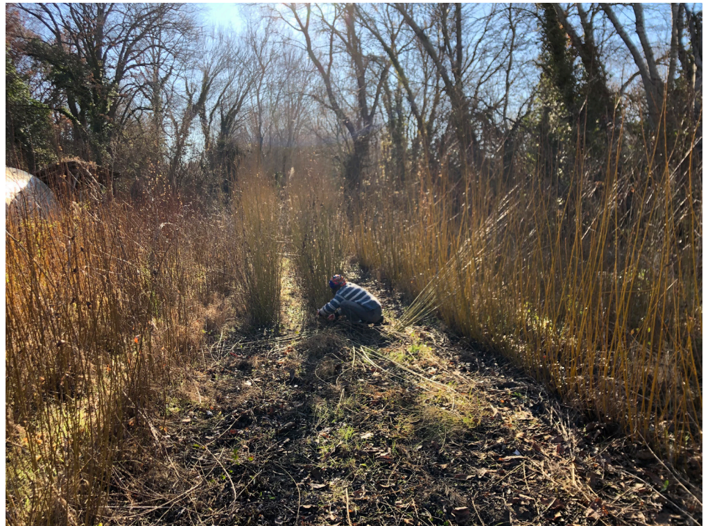
Coupe de l'osier, Cucuron, janvier 2024

Tresser les savoirs-faire Tresser les savoirs-faire Tresser les savoirs-faire