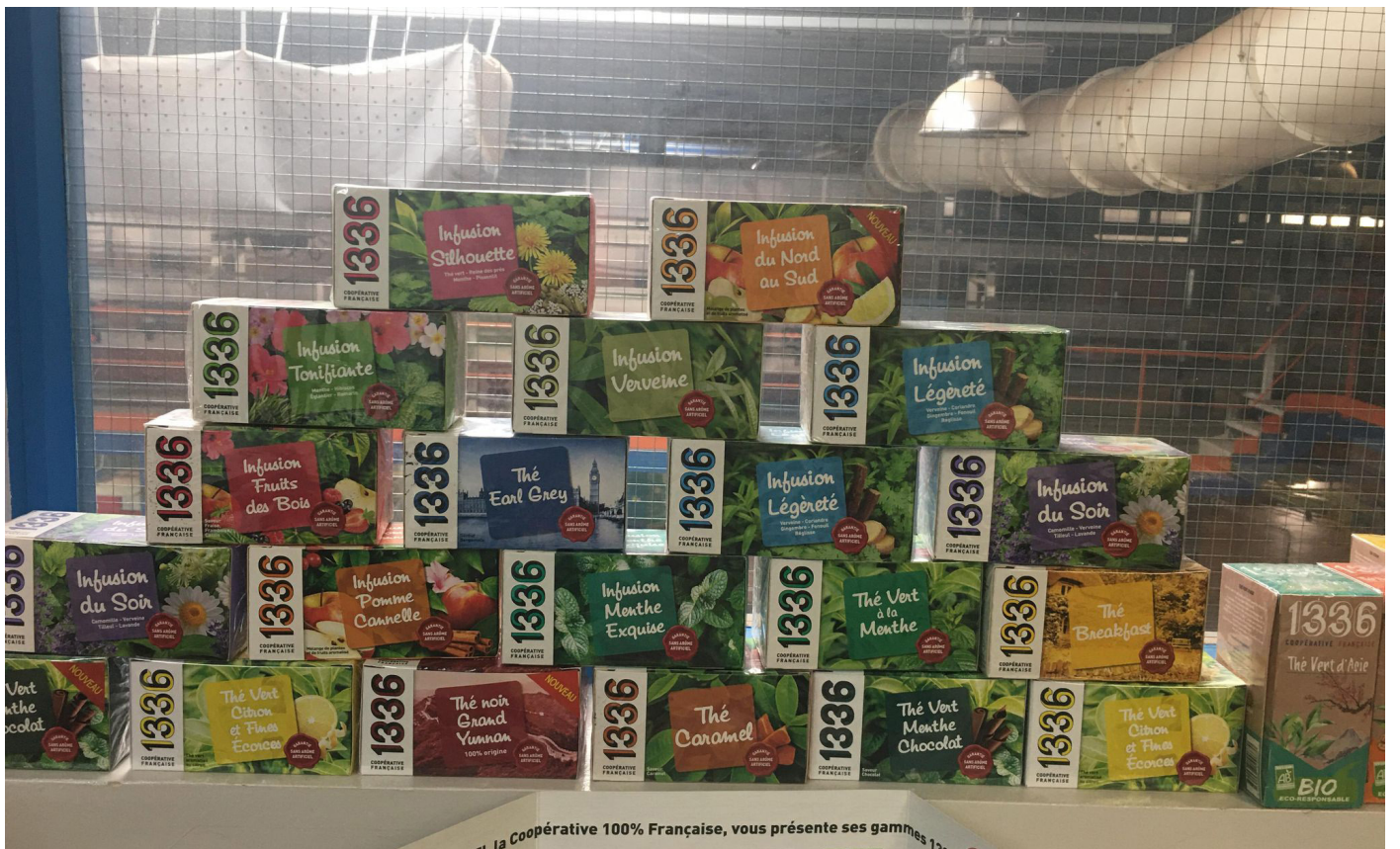
Boîtes de thés et tisanes 1336